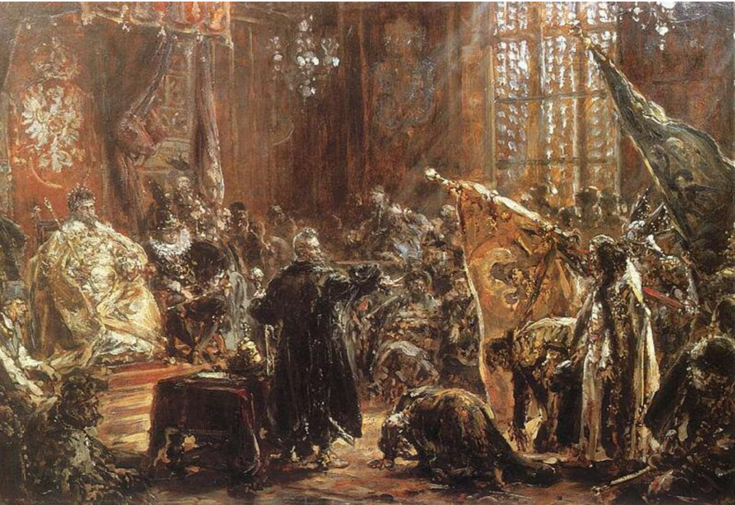
Stanisław Żółkiewski przedstawia carów Szujskich na sejmie warszawskim 1611, mal. Jan Matejko

Ponadto Żółkiewski miał rozległe dobra w okolicach Brodów i Boryspola w województwie ruskim. Zapewniały mu one ponad 100 tys. zł rocznie, do tego należy dodać zyski ze starostw królewskich. Ponieważ syn hetmana zmarł młodo i bezpotomnie, cała fortuna przeszła na zięciów: wojewodę ruskiego Jana Daniłowicza i hetmana Stanisława Koniecpolskiego. W przyszłości stała się podstawą majątku Sobieskich – król Jan III był prawnukiem hetmana Żółkiewskiego.