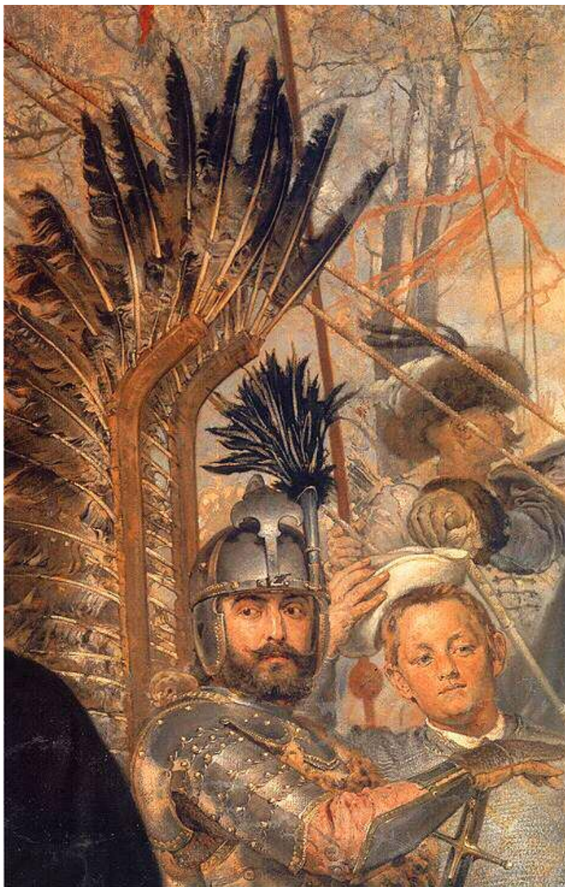
Młody Stanisław Żółkiewski na fragmencie obrazu Jana Matejki Stefan Batory pod Pskowem

czył do Mołdawii, gdy była już zakończona wojna moskiewska – choć ta wyprawa zakończyła się klęską i śmiercią hetmana. Jako polityk związany był więc z dworem i szanował wolę królewską, nawet jeśli często sam miał inne zdanie.