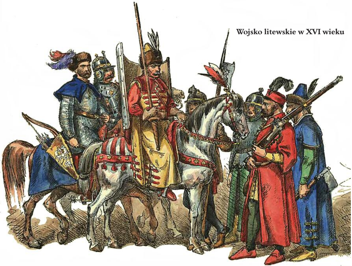
Wojsko litewskie w XVI wieku

Kłopoty z Moskwą zaczęły się na tle rywalizacji o Inflanty. Żądny sukcesów „Rudy” chciał siłą podporządkować je Litwie. Wyprawy wojenne z lat 1556 i 1557 nie dały mu jednak okazji do popisu. Podupadający, ale nadal rządzący Inflantami zakon kawalerów mieczowych już po pierwszych potyczkach szedł na ugodę i przyjmował litewskie warunki. Władca moskiewski Iwan Groźny nie mógł pozwolić, by Litwini ubiegli go w wyścigu do Inflant i w 1558 roku zaczął podbój tego kraju. Kawalerowie mieczowi podporządkowali się zatem Litwie w zamian za ochronę. Wtedy na barki Radziwiłła spadło zadanie odepchnięcia Moskwy od Bałtyku.