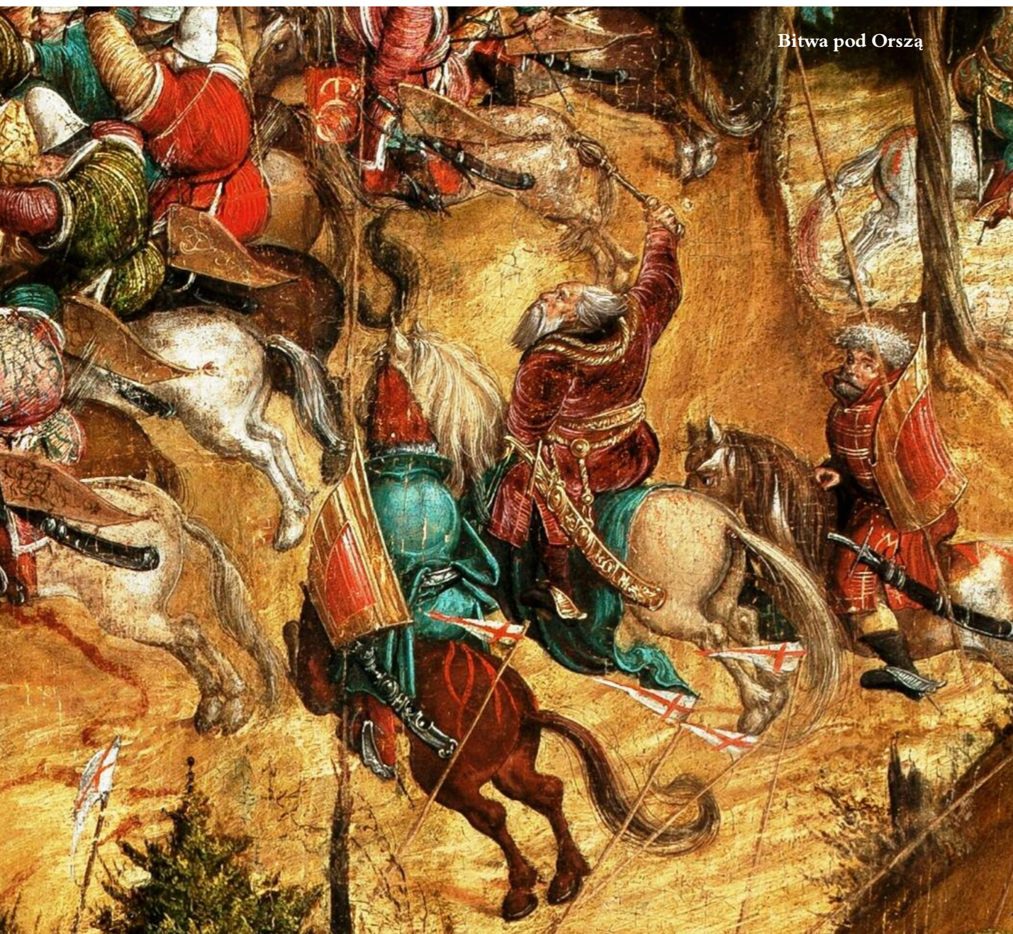
Bitwa pod Orszą